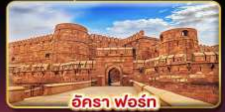
อัครา ฟอรั