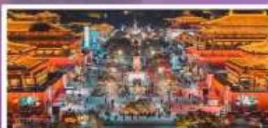
ถนนวัฒนธรรมราชวงศ์ถัง