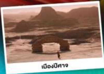
เมืองปีศาจ