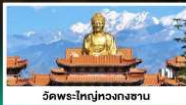
วัดพระใหญ่ทองกงซาน