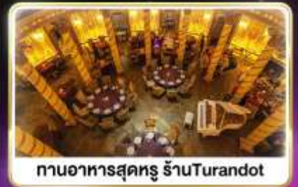
กานอาหารสุดหรู ร้านTurandot