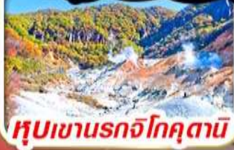
หุบเขานรกจิกุคาชิ

รวม ค่าภาษีที่ปรับขึ้นแล้ว (ประกาศ 1 เม.ย. และ 26 พ.ค. 69)