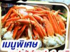
เมนูพิเศษ บุฟเฟ่ต์ซาปู 1 ชนิด

ราคาเริ่มต้น 31,999 *รวมภาษีสนามบินแล้ว*