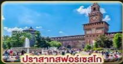
ปราสาทพnomชhnok

เดินทาง : 28 พ.ค. - 06 มิ.ย. | 05-14 ส.ค. 15-24 ต.ค. 69