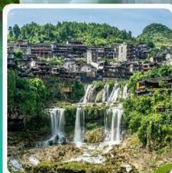
ฟุ่หลงจีน