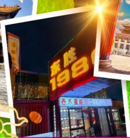
ถนนคนเดินคังบาร์ซี