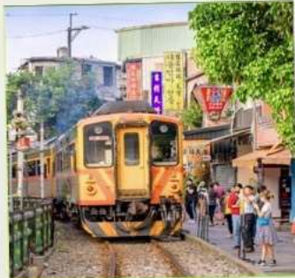
สถานีรถไฟซือเฟิ่น