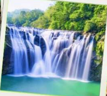
น้ำตกซือเฟิ่น