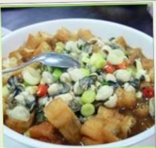
ถนนโบราณซือเฟิ่น